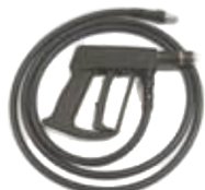
Sprøjt pistol til lanse