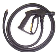
Sprøjt pistol m. slange