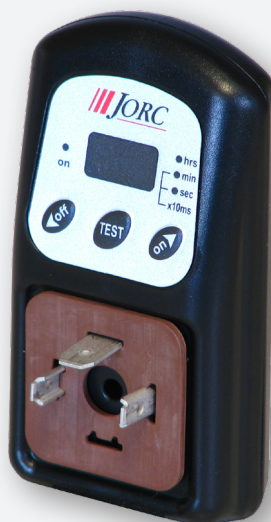
Digital timer, 8500-Digital